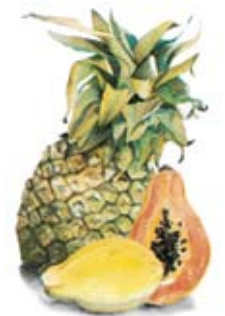
Ananas und Papaya – Früchte mit natürlichen Enzymen

Die fehlenden körpereigenen Enzyme können durch astoral Almazyme, einem Enzym-haltigen Futterzusatz in Pulver- oder Tablettenform ersetzt werden. astoral Almazyme enthält zudem Lecithin für einen optimalen Fettaufschluss sowie B-Vitamine für eine gute Verarbeitung der Nährstoffe im Körper.