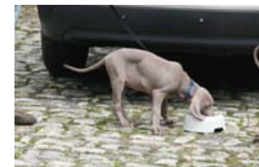
Machen Sie regelmäßige Pause während der Reise und bieten Sie immer etwas frisches Wasser an.