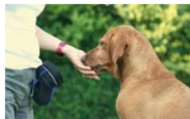
Wichtig: jedes richtige Verhalten erst einmal mit einem Leckerchen belohnen