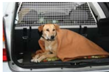
Verschaffen Sie dem Hund schrittweise angenehme Erlebnisse im Auto. So gewöhnt er sich an den Aufenthalt im Kofferraum.