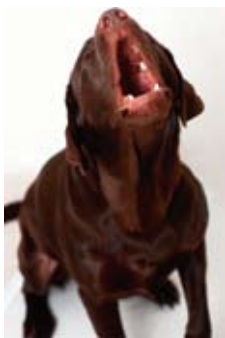
Jaulen und Bellen beim Fahren können erste Anzeichen für ausgeprägtes Unbehagen sein.

Bevor Sie sich also zusammen mit Ihrem Vierbeiner in »die schönste Zeit des Jahres«, Ihren Urlaub aufmachen, testen Sie lieber einmal, ob er Autofahren überhaupt verträgt. Und starten Sie bald mit dem Fahrtraining.