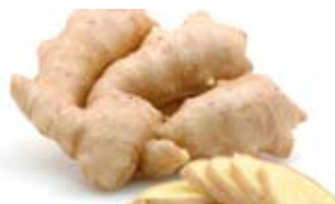
Ingwer – die »Wunderknolle« aus dem Fernen Osten sorgt nicht nur bei Menschen für einen stabilen Magen.