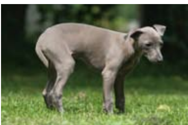
Speicheln und aufgezogener Bauch: Dieser Hundewelpen steht kurz vor dem Erbrechen.

Und so macht sich Ihr Hund bemerkbar, wenn es ihm unwohl wird: