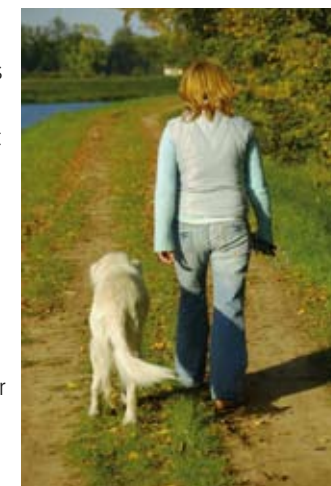
Erholung nach der Reise: Stressabbau durch gemeinsame Erkundung der neuen Umgebung